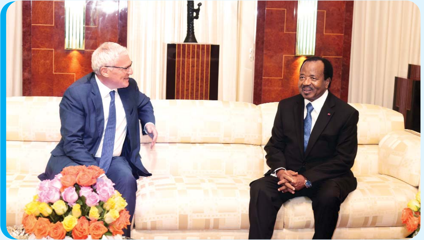
Le Président Paul BIYA, un engagement total pour la construction du barrage de Nachtigal, un grand projet de la politique des Grandes Réalisations, qui se traduit déjà par de grands succès dans le domaine de l'énergie comme à Lom Pangar.