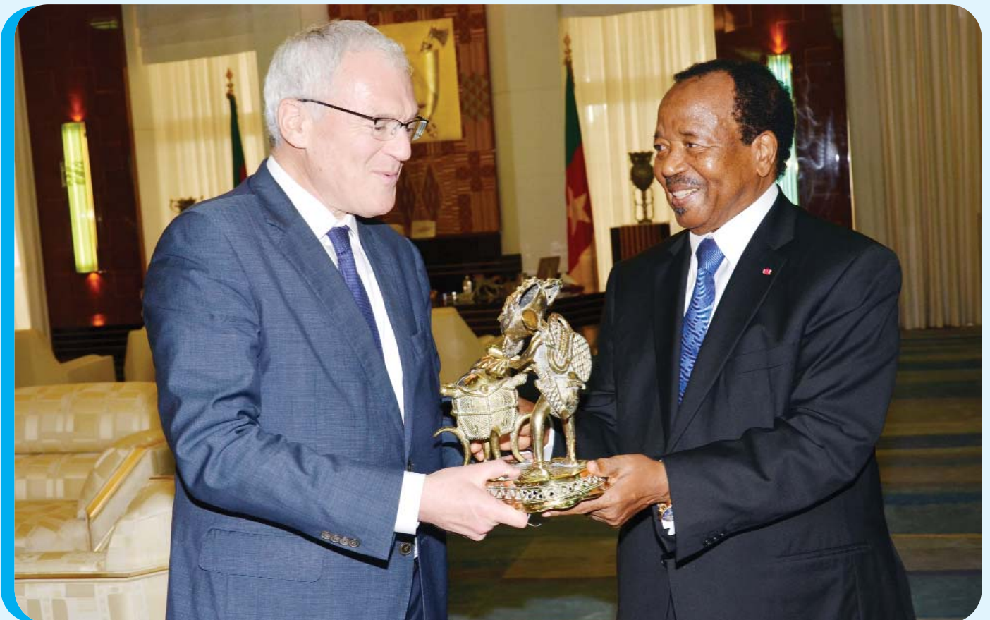
Belle récompense pour la confiance faite au Cameroun.