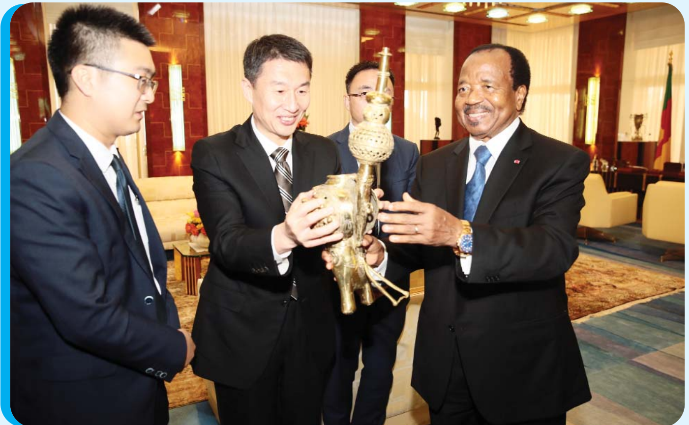
A gift from the President of the Republic in appreciation of the commitment of Huawei for the development of the digital economy in Cameroon.