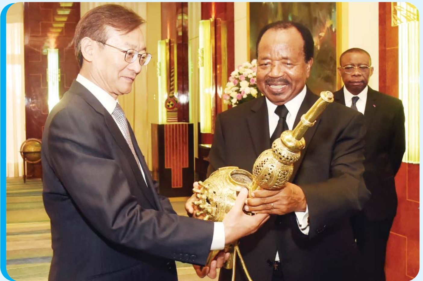
Au nom de la grande amitié sino-camerounaise et en souvenir de la visite au Cameroun.